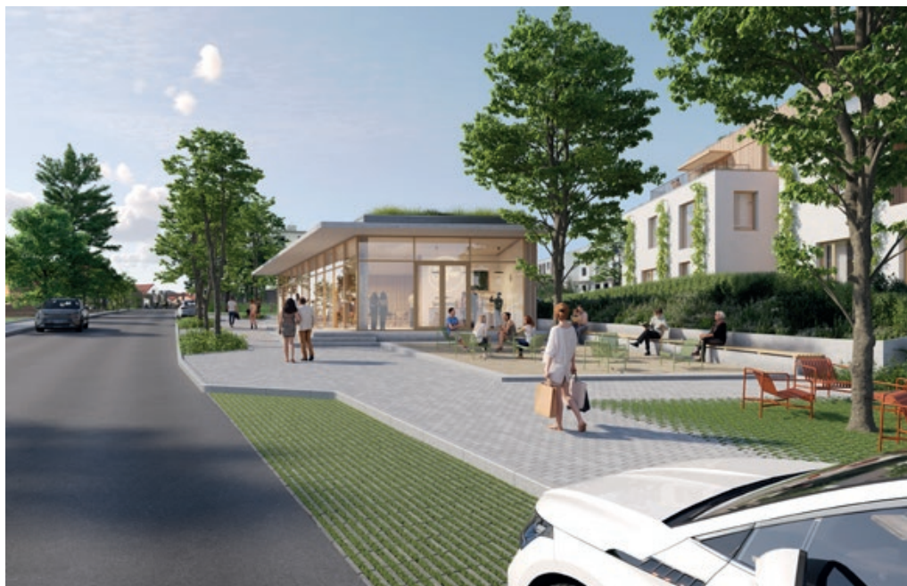
Piazzetta s kavárnou a veřejným prostorem

Další byty vyrostou na křižovatce Černošické a Oddechové vedle golfového klubu a restaurace Soulad. Na pozemku o celkové výměře 8730 m 2 investor postaví čtyři bytové domy se 43 převážně malými a středními byty 1KK až 3KK. Vždy dva